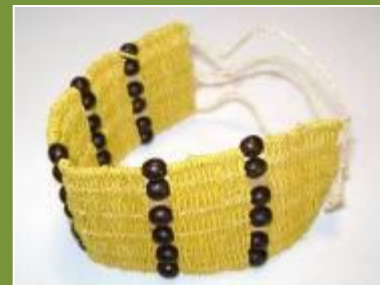
Pulsera tejida en Chambira

Por último se tuercen las fibras de la chambira para formar un hilo largo, con este hilo es con el que luego se tejerá.