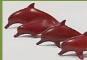
Delfín rosado en Palo de Sangre

Utilizan madera de Palo de Sangre para hacer figuras representativas Tikunas de su flora y fauna. Los acabados se logran sin brillos artificiales.