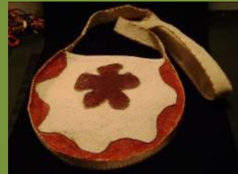
Cartera en Yanchama

Yanchama es la corteza de un árbol que los indígenas pintan con tintes naturales, usando símbolos, que son importantes en su cultura.